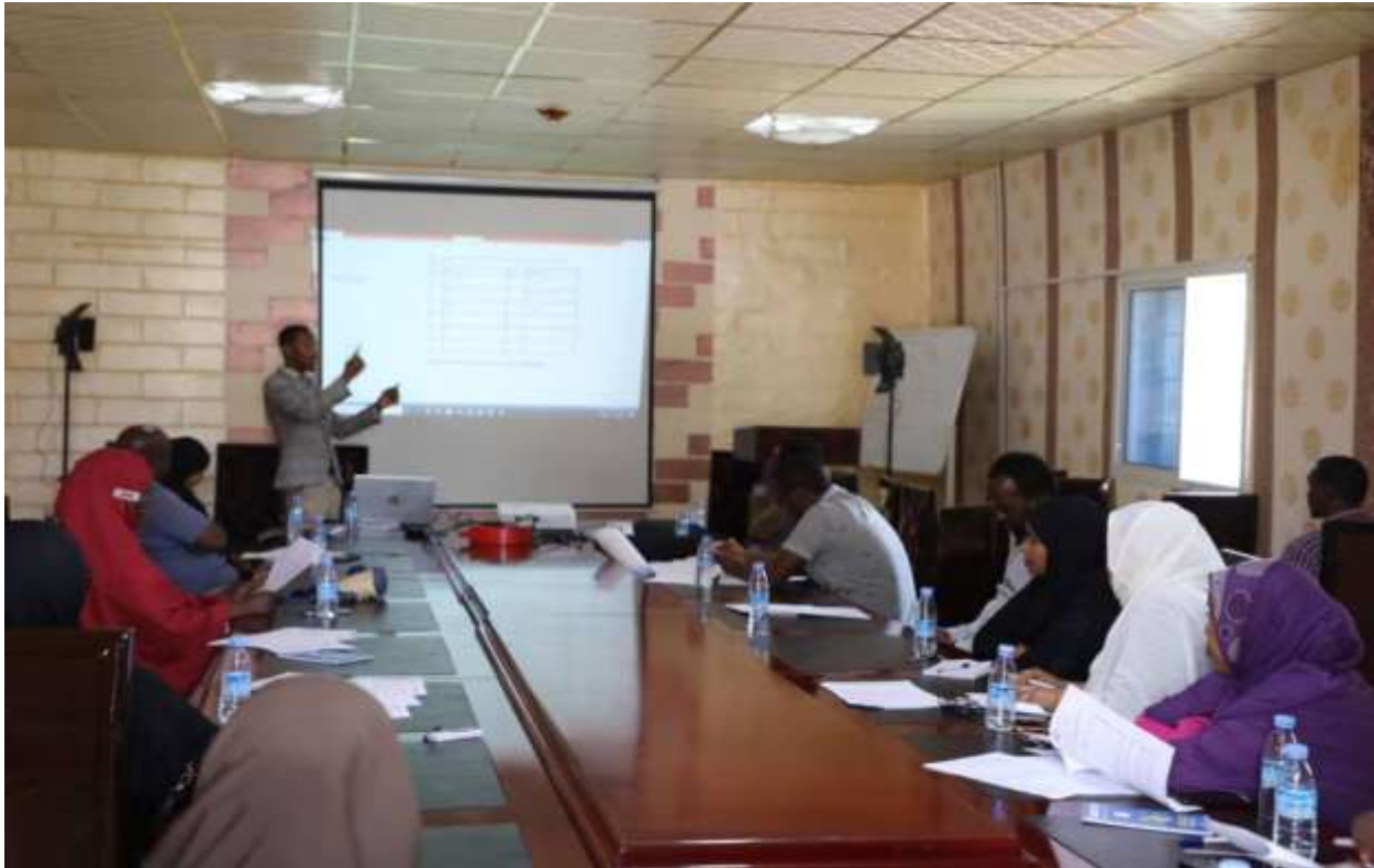
Xigasho: 2020, Tababarka waaxda qiimaynta shaqada iyo shaqaaluhu u qabatay wasaaradda Isgaadhsiinta iyo tiknoolijiyada

Waaxda qiimaynta hawl-qabadyada shaqaalaha ee Hay'adda Shaqaalaha Dawladdu waxa ay tababarro joogta ah ku qabatay dhamaan xarumaha wasaaradaha iyo hay'adaha dawladda, tababarradaas oo ay qaateen dhamaan agaasimayaasha waaxaha iyo madaxa xafiisyada iyo hay'adaha dawladdu waxa lagu baranayey siyaasadda qiimaynta hawl-qabadyada shaqaalaha dawladda iyo qalabka loo isticmaalayo marka la samaynayo qiimayntaas.