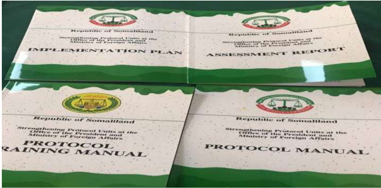
Xigasho; 2020, HSHD, Buugta hagaha hab-maamuuska qaranka.