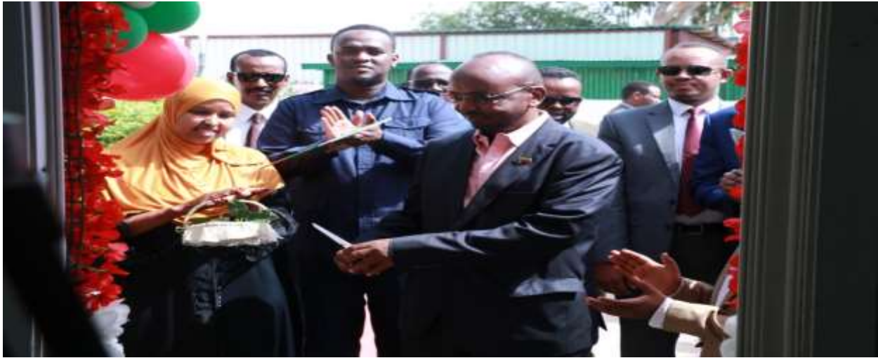
Xigasho: 2020, HSHD, Guddoomiyaha Hay'adda Shaqaalaha Dawladda oo xadhigga ka jaraya xafiiska kaydka xogta shaqaalaha dawladda