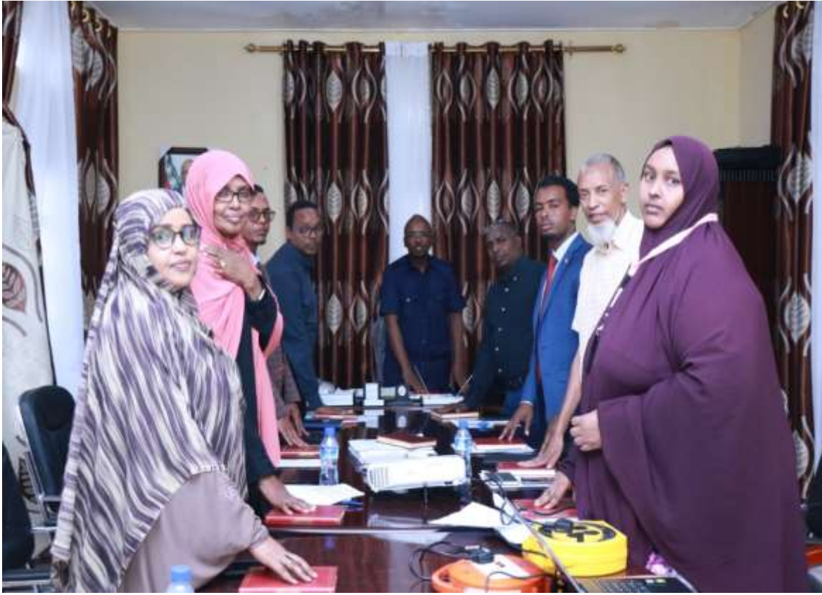
Xigasho,2020 HSHD, Dhaarinta Gudiga Imtixaanka iyo Xulista Xubnaha Maamulka Cibsitaalka Guud ee Hargeysa

Dhamaan xubnaha ay ka koobantahay gudida farsamo ee kor ku sheegan waxa lagu dhaariyey in ay daacad ka noqdaan barnaamijka dib u habaynta cisbitaalka guud ee Hargeisa iyo in ay cadaalad u sameeyaan tartamayaasha soo codsaday in ay u tartamaan boosaska shaqo oo cisbitaalka guud. Dhaarinta ka dib waxa ay xubnaha gudiga farsamo oo si dhaw ula shaqaynaya waaxda shaqaalaysiinta ee Hay'adda Shaqaalaha Dawladdu bilaabeen kala gurka iyo hubinta dhukumantiyadda codsadaayaasha oo tiradoodu dhamayd 544-tartame waxanay soo saareen in liistada gaaban (short list) ay ku soo baxeen tartamayaal tiradoodu dhantahay 65-Tartame , tartamayaasha ku soo baxay liistadda gaaban waxa ay mudo yar ka dib u fadhiisteen imtixaan qoraala (Written test) sida siyaada shaqaalaysiinta ee Hay'adda Shaqaalaha Dawladdu dhigayso waxa tartamayaasha hadana laga qaaday imtixaan waraysi ah (Interview) si loo hubiyo xirfadooda shaqo iyo heerkooda waayo-aragnimo ee ay u leeyihiin hab-maamulka shaqooyinkacisbitaalka, waxana natiijadu noqotay in ay soo baxaan tartamayaasha aanu halkan hoose ku xusnay magacyadooda iyo boosdkooda shaqoba;