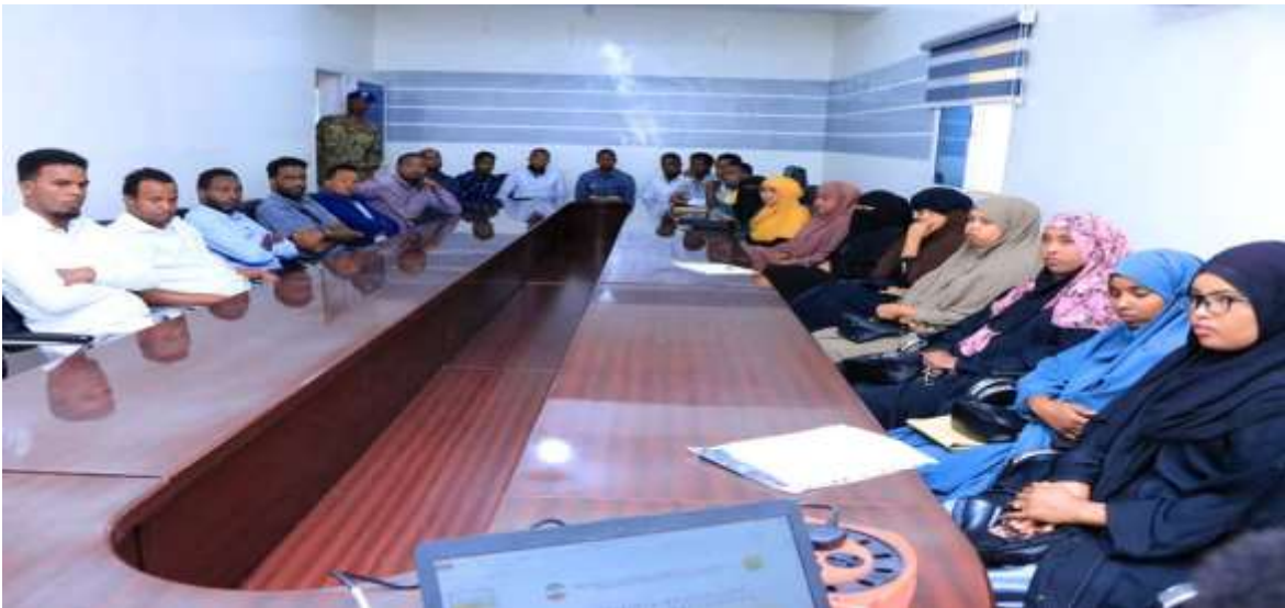
Xigasho: 2020, Liiska shaqaalaha Shaqo Qaran ee lagu wareejiyey Wasaaradda Maalgashiga

10 September, 2020kii ayaa la soo gabo-gabeeyay diwaa gelinta dufcaddii koobaad ee xubnaha barnaamijka Shaqo Qaran ee dalka oo dhan iyada oo la sugay dhamaanba xogtii looga baahnaa oo ay ku jirto xaqiijinta magacyadooda rasmiga ah iyo xaqiijinta shahaadooyinka waxbarasho ee ay sitaan iyo in ay ku jiraan xubno shaqaale dawladeed hore u ahaa iyada oo la isticmaalayo nidaamka iyo barnaamijka casriga ah ee biometric systemka oo sawirayay faraha iyo indhaha qofka shaqaalaha ah.