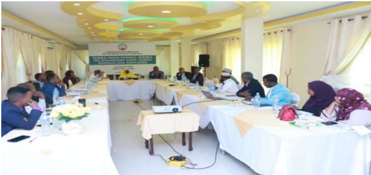
Xigasho: 2020, Shirkii Wada tashiga Xeerka iyo Siyaasadda Hawl-gabka qaranka

Ugu dambayn, hirgelinta qorshaha hayaanka hawl-gabka qaranka ayaa la rajaynayaa in bilowga sannadka cusub ee 2021 la daah-furo iyada oo loo diyaariyay miisaaniyad sannadeedkii, dhismihii iyo goobtii lagu shaqayn lahaa iyo waliba shaqaalihii hirgalinta iyo fulinta barnaamijkan ka shaqayn lahaa, waxaana barnaamijkan si wayn ugu dheg taagaya bulsho waynta Somaliland , shaqaalaha dawladda iyo guud ahaan daneeyayaasha barnaamijkan.