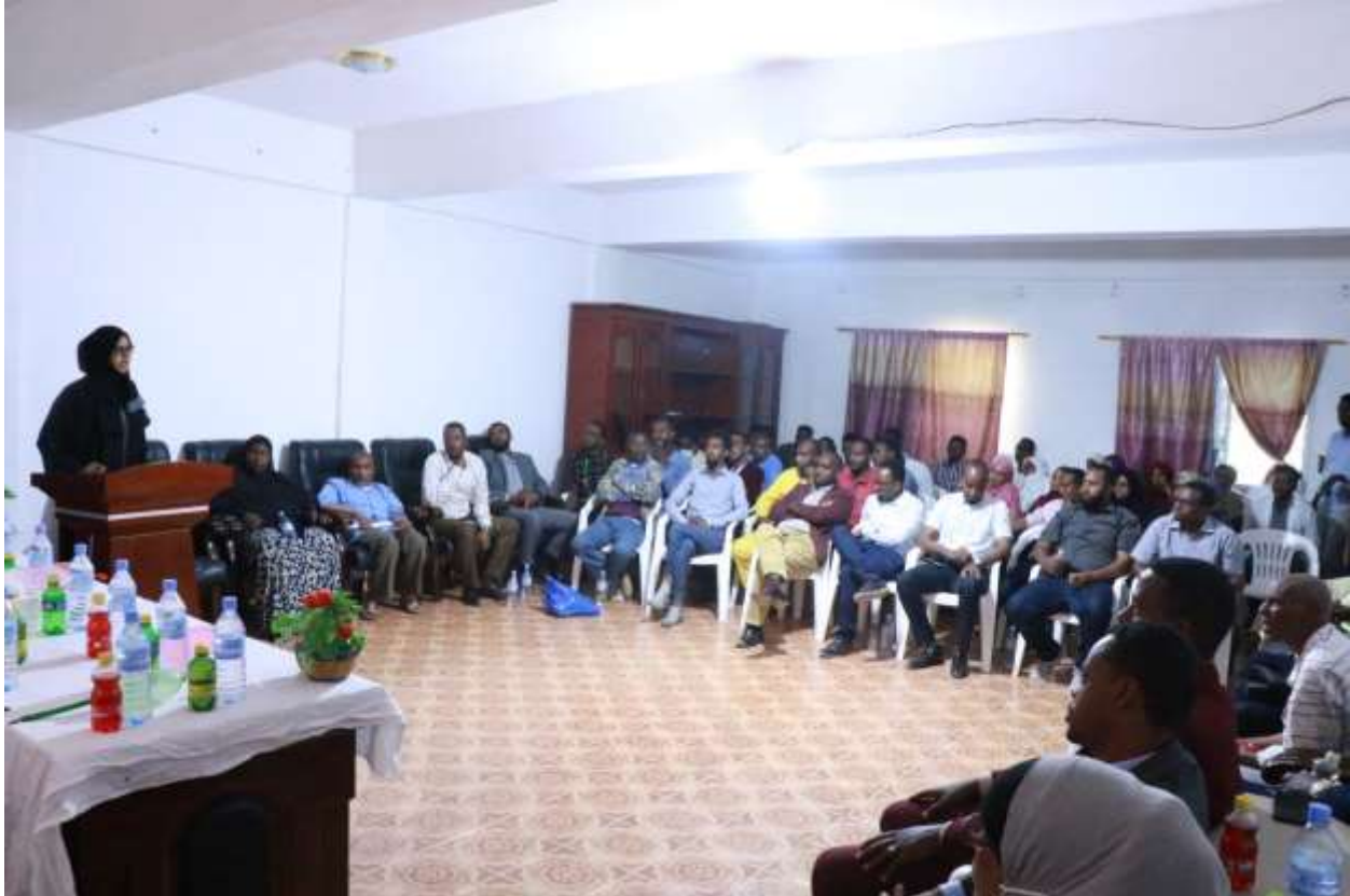
Xigasho: 2020, Xil-wareejintii shaqaalaha cusub ee cusbitaalka guud ee Hargeysa