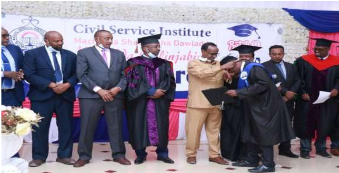
Xigasho: 2020, Mac-hadka shaqaalaha dawladda/qalinjabinii ardayda Mac-hadka ee sannadka 2020ka

Sidoo kele waxa jira arday ku kala jirta kulliyadaha kala duwan ee mac-hadka kuwaas oo maraya heerar kala duwan. Shaxda hoose ayaana muujinaysa faah-faahinta xogta kulliyadaha ay ku kala jiraan, tiradooda iyo jinsiga ay yihiin: