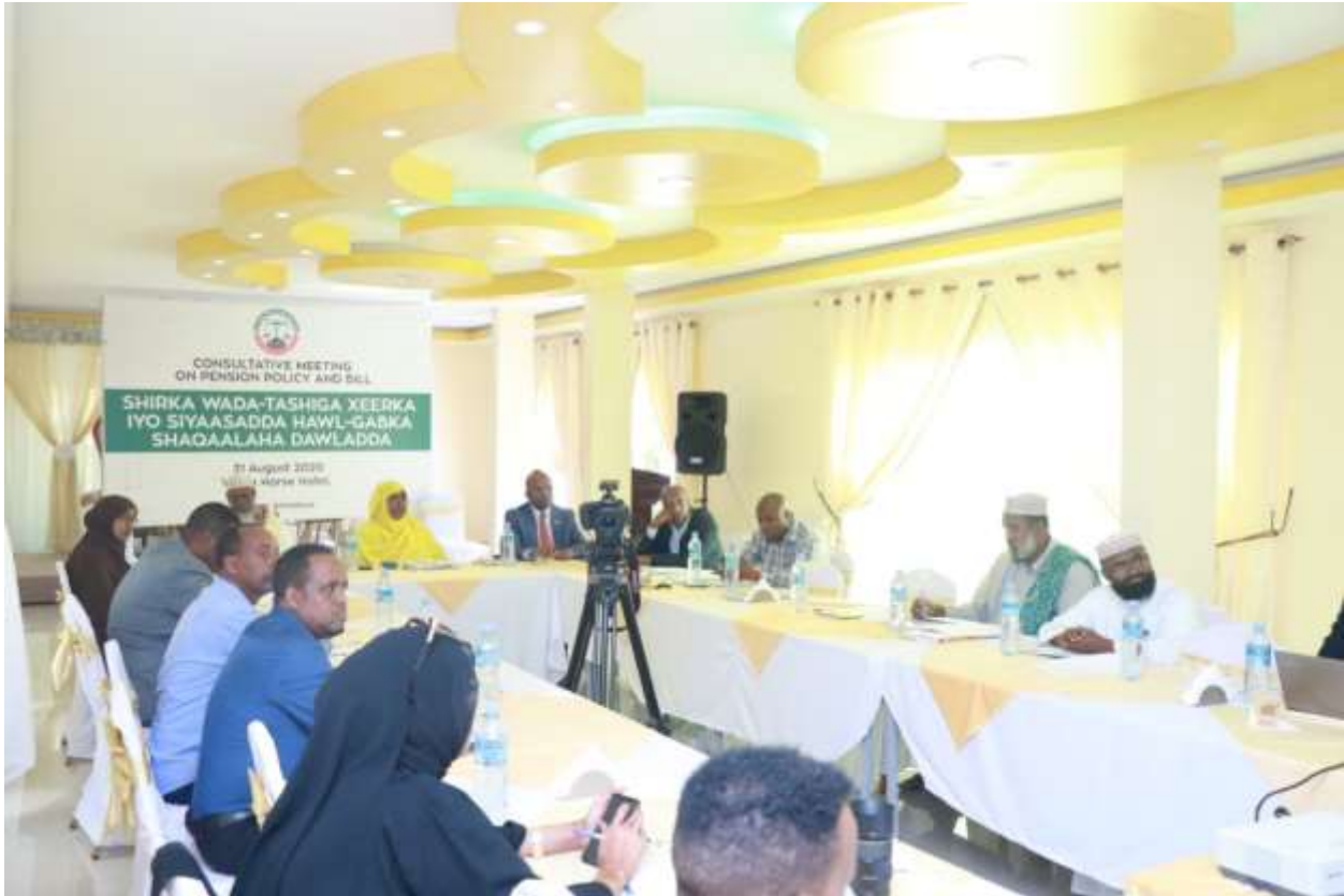
Xigasho: 2020, Shirkii Wada tashiga Xeerka iyo Siyaasadda Hawl-gabka qaranka

Qorshaha Horumarinta Hawl-gabka Shaqaalaha Qaranka ayaa laga yagleelay Hay'adda Shaqaalaha Dawladda iyada oo loogu magac daray qorshahan ( Hayaanka Qorshaha Hawl-gabka Shaqaalaha Qaranka ). Dhamaystirka qorshahani hada waxa uu ku dhaw yahay gebogebo, waxaana hadda socda qorshihii lagu hirgelin lahaa sannadkan fooda innagu soo haya ee 2021ka. Siyaasadda iyo xeerka hawl-gabka shaqaalaha qaranka ayaa iyaduna qorshaysan in sannadkan soo socda horraantiisaba la horgeeyo Golaha Wasiirrada si ay uga doodaan, ka dibna loogu gudbiyo Golaha Wakiillada JSL.