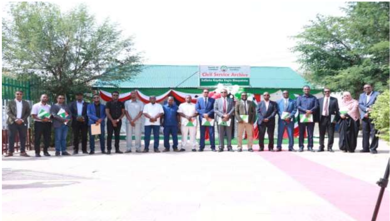
Xigasho: 2020, HSHD, Xafladdii furitaanka xafiiska kaydka xogta shaqaalaha