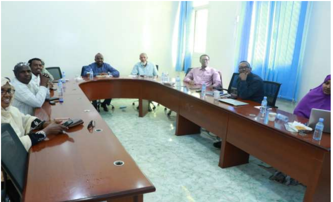
Xigasho,2020 HSHD, Gudiga Imtixaanka iyo Xulista Xubnaha Maamulka Cibsitaalka Guud ee Hargeisa

Sida aan kor ku soo sheegnay warbixinta qiimaynta adeega maamul ee cisbitaalka guud ee Hargeisa waxa ka soo baxday soo jeedin ah in maamulayaasha laamaha kala duwan ee cisbitaalka guud oo mudo dheer ka shaqaynayay cisbitaalka wax laga badalo isla markaana dib loo eego lagu sameeyo kala saraynta iyo awoodaha shaqo ee saraakiisha cisbitaalka.