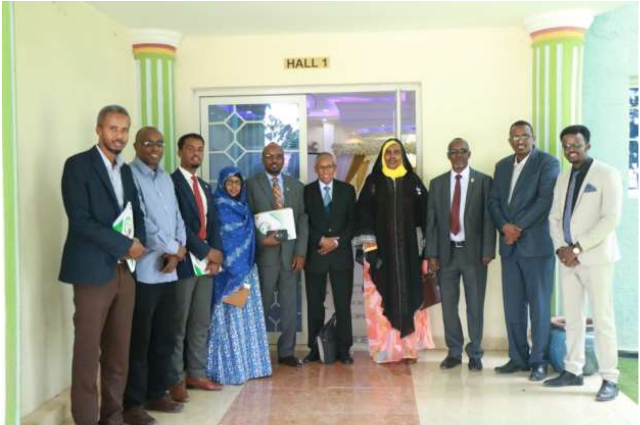
Xigasho; 2020, hshd kulanka sadex-biloodlaha ahaa ee xubnaha gudiga mashruuca (streering committee)