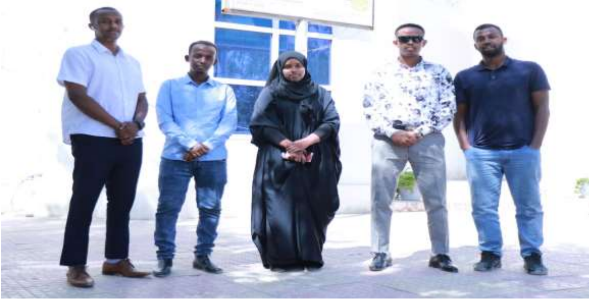
Qaar ka mid ah xubnaha Shaqo Qaran oo ka mid noqday Hay'adda Shaqaalaha Dawladda

10 September, 2020kii ayaa la soo gabo-gabeeyay diwaa gelinta dufcaddii koobaad ee xubnaha barnaamijka Shaqo Qaran ee dalka oo dhan iyada oo la sugay dhamaanba xogtii looga baahnaa oo ay ku jirto xaqiijinta magacyadooda rasmiga ah iyo xaqiijinta shahaadooyinka waxbarasho ee ay sitaan iyo in ay ku jiraan xubno shaqaale dawladeed hore u ahaa iyada oo la isticmaalayo nidaamka iyo barnaamijka casriga ah ee biometric systemka oo sawirayay faraha iyo indhaha qofka shaqaalaha ah.