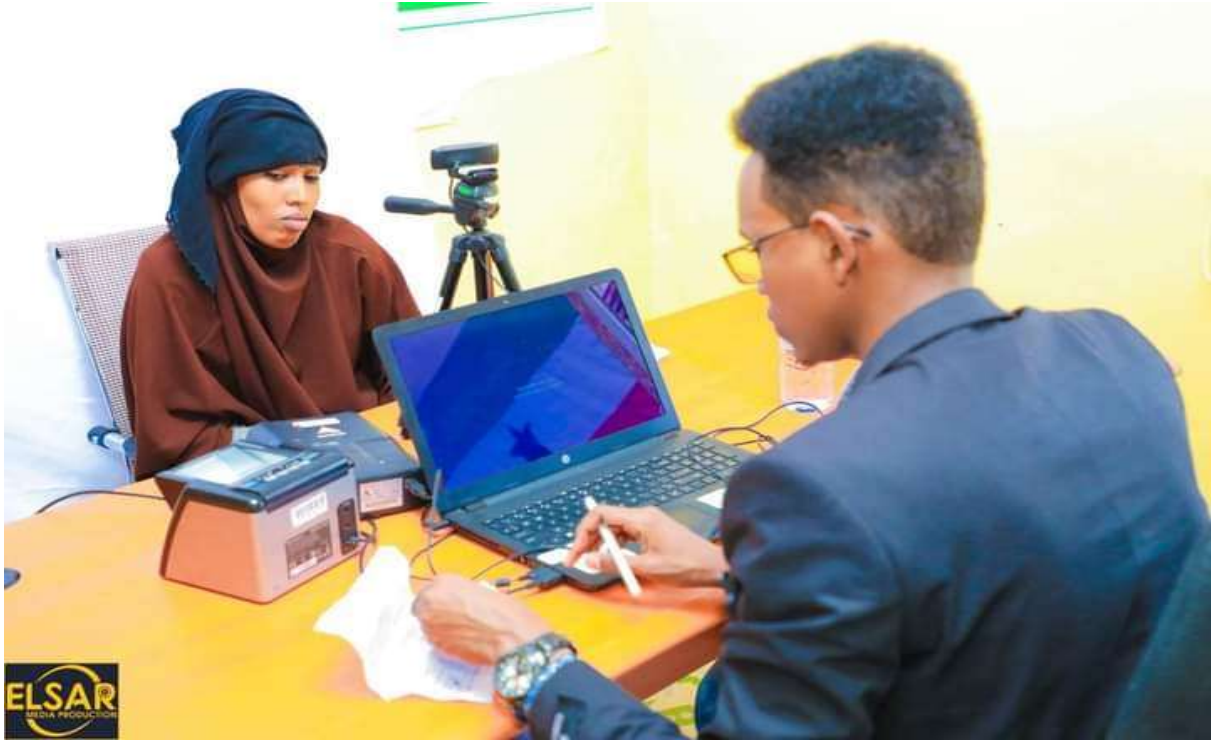
Xigasho: 2020 Diiwaangelinta shaqaalaha, Ceerigaabo, Sanaag

Sidoo kele isla-xilligaas waxa jiray shaqaale aan marin diiwaan-galinta Hay'adda Shaqaalaha Dawladda oo ku maqnaa sababo la xaqiijiyey sida fasax sannadeedka caadiga ah, fasaxyo caafimaad iyo kuwo waxbarasho, kuwaas oo sharciga shaqaaluhu u ogolaanayay in ay ku sii jiraan liiska mushahar bixinta shaqaalaha dawladda isla markaana la diiwaangaliyey.