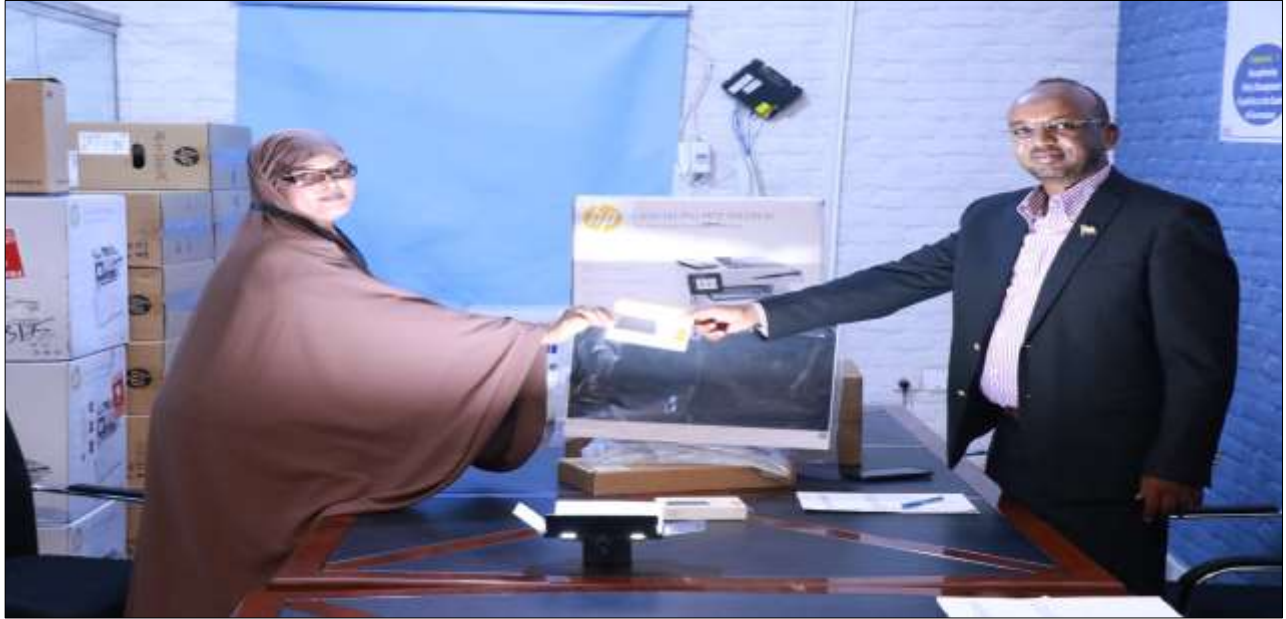
Xigasho: 2020, HSHD Guddoonsiintii qalabka ee wasaaradda Cadaaladda