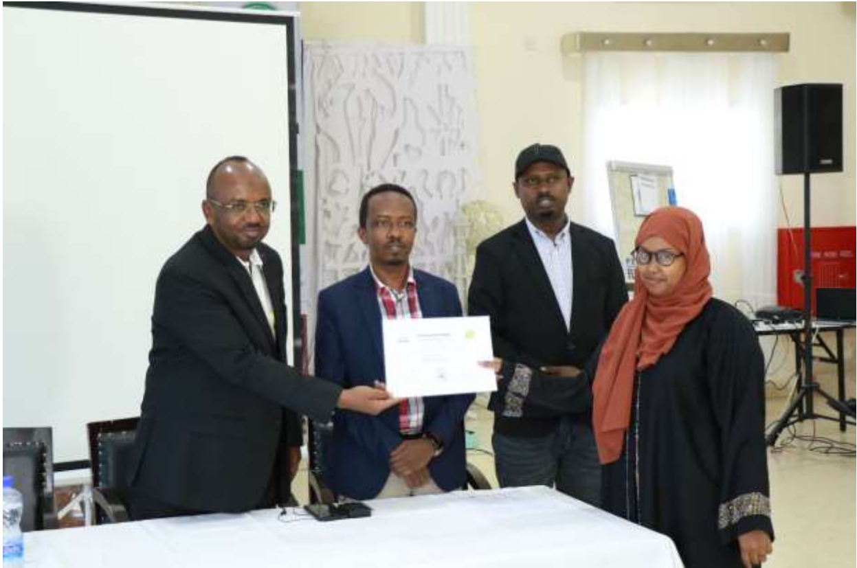
Xigasho: 2020, CSI, Tababarrada gaagaaban ee uu bixiyay mac-hadka shaqaalaha dawladdu

Mac-hadku waxa uu bixiyaa shahaado Diploma ah oo la xidhiidha dhanka luuqadda Ingiriisida ah oo loogu talagalay in kor loogu qaado koboca luuqadda Ingiriisida ee shaqaalaha Dawladda, sannad kastana waxa ka baxa tiro shaqaale ah oo qaata kooraskan, sannadka 2020ka waxa Mac-hadka kooraskan ka qaatay shaqaale tiradoodu dhan tahay 44 qof, kuwaas oo faahfaahintoodu sidan tahay: