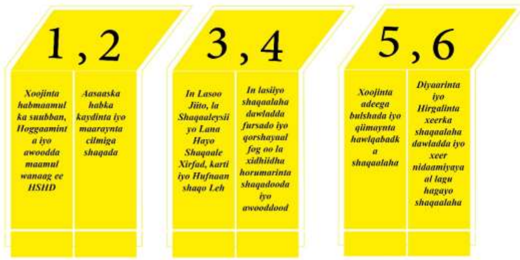
Xigasho: 2020, Waaxda Qorshaynta Ee HSHD

Hay'adda Shaqaalaha Dawladu, waxa ay dejisay qorshe hawl qabad oo shan sanno ah kaas oo ku qotoma qorshaha horumarinta qaranka JSL, qorshahaas oo loo raaco waxii hawl ay qabanayso sannad kasta hay'addu. Lixdan bar-tilmaameed ee hoos ku shaxaysani waa tiirarka uu ku fadhiyo qorshaha shanta sano ee Hay'adda Shaqaalaha Dawladdu (CSC Five Years Strategic Plan), waxana loo xushay in ay yihiin kuwa ugu mudan ama ugu muhiimsan ee ay ka farcamayaan shaqooyinka ay qaranka u hayso Hay'adda Shaqaalaha dawladdu, waana kuwa aasaaska u ah qorshe sannadeedka 2020ka ee Hay'adda.