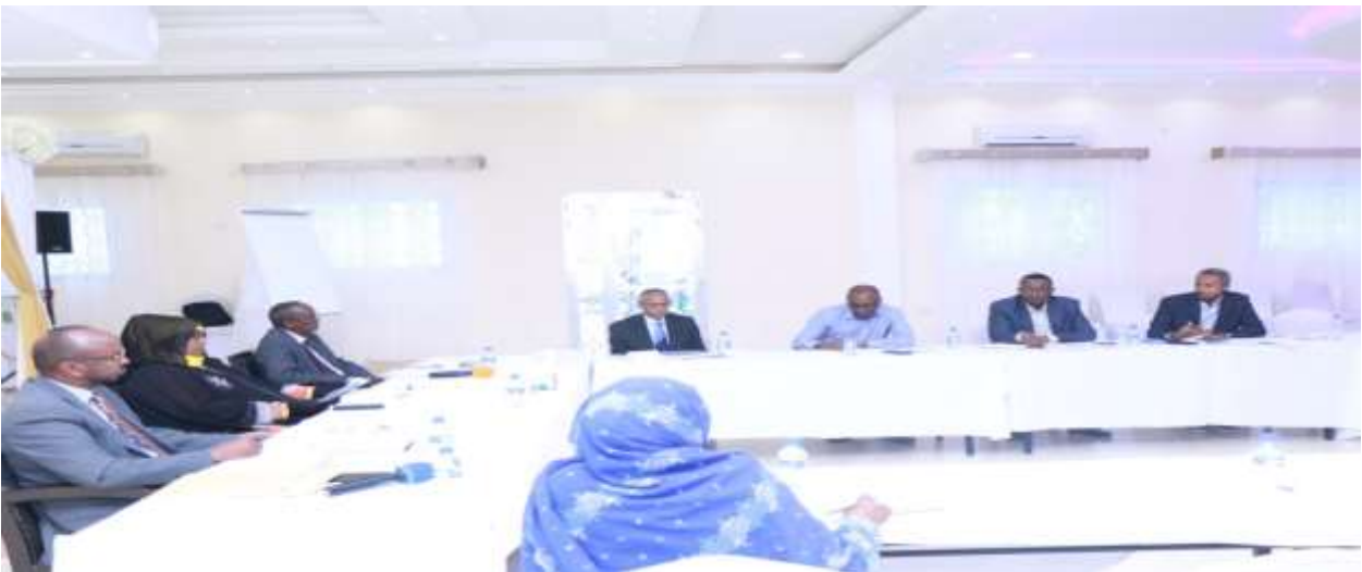
kulanka sadex-biloodlaha ah ee xubnaha gudiga mashruuca (streering committee)

Shirarka kale ee ay Hay’adda Shaqaalaha Dawladdu sannadkan qaban qaabisay waxa ka mid ahaa shirkii gudida wasiiradda ah ee haga barnaamijka dib u habayna shaqaalaha dawladda shirkan oo sadex biloodle ah ayaa sannadkan qabsoomay hal mar oo ahayd 11 Agosto 2020 sababo la xidhiidha xanuunka saf marka ah ee covidh 19.