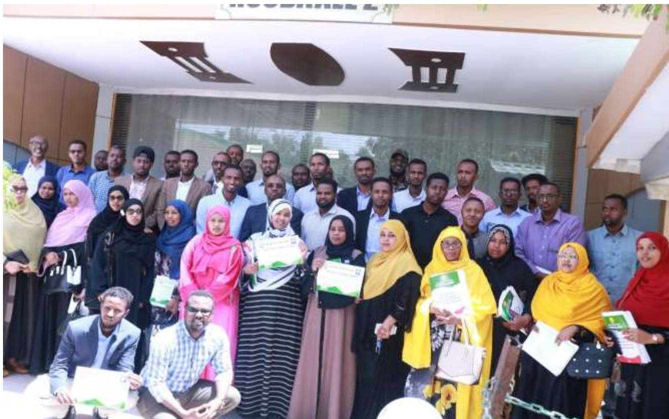
Xigasho: 2020, HSHD, Guddoomiyaha Hay'adda Shaqaalaha Dawladda oo tababar u soo xidhay Agaasimayaasha waaxyaha cududda shaqaalaha ee wasaaradaha iyo hay'adaha dawladda