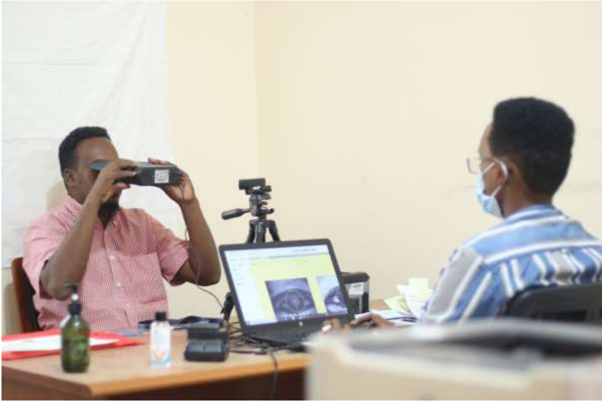
Diiwaangelinta Shaqaalaha Ku Meel Gaadhka ah