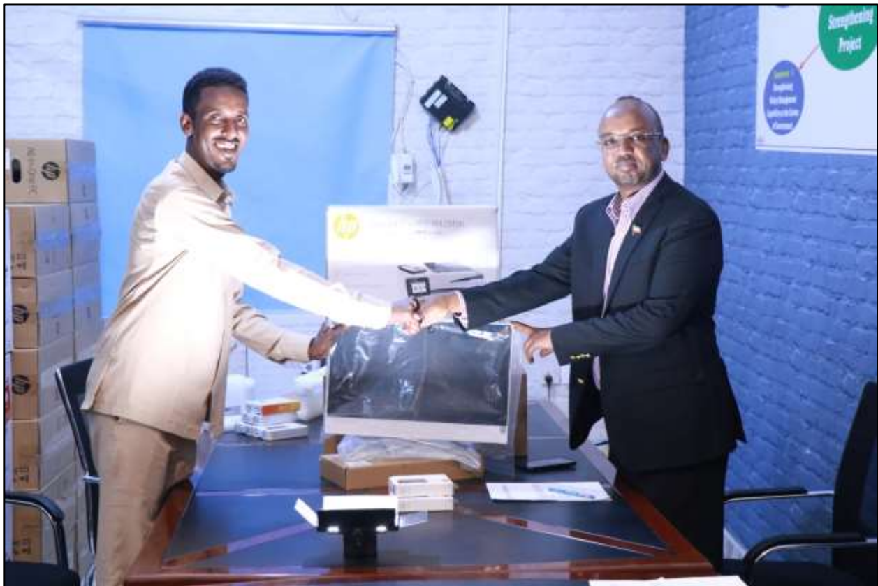
Xigasho: 2020, HSHD Guddoosiintii qalabka ee wasaaradda Gaashaandhiga

Waxa gebi ahaanba dib loo habeeyay qaabka xafiisyada xidhiidhka dad-waynaha, xafiiska kaydka xogta shaqaalaha (national civil service archive) iyo xafiiska ilaalinta mushaharka shaqaalaha dawladda (payroll control office) iyada oo qalabayn ballaadhan lagu sameeyay laguna qalabeeyay agab xafiis oo dhamaystiran, kombuyuutaro, daabacaado (printers) iyo dhamaan wixii qalab hawl lagu socodsiin lahaa oo dhan.