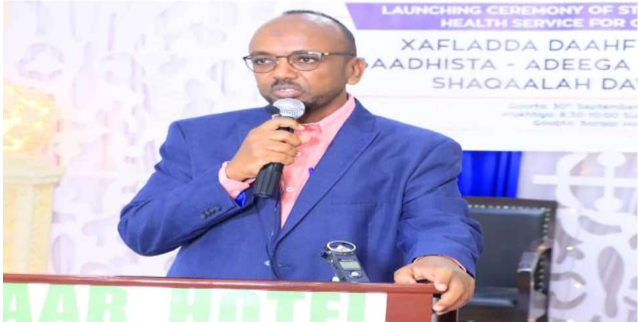
Xigasho: 2020 HSHD, Guddoomiyaha Hay'adda Shaqaalaha Dawladda oo ka qayb galay xafladda daahfurka daraasadda caafimaadka shaqaalaha