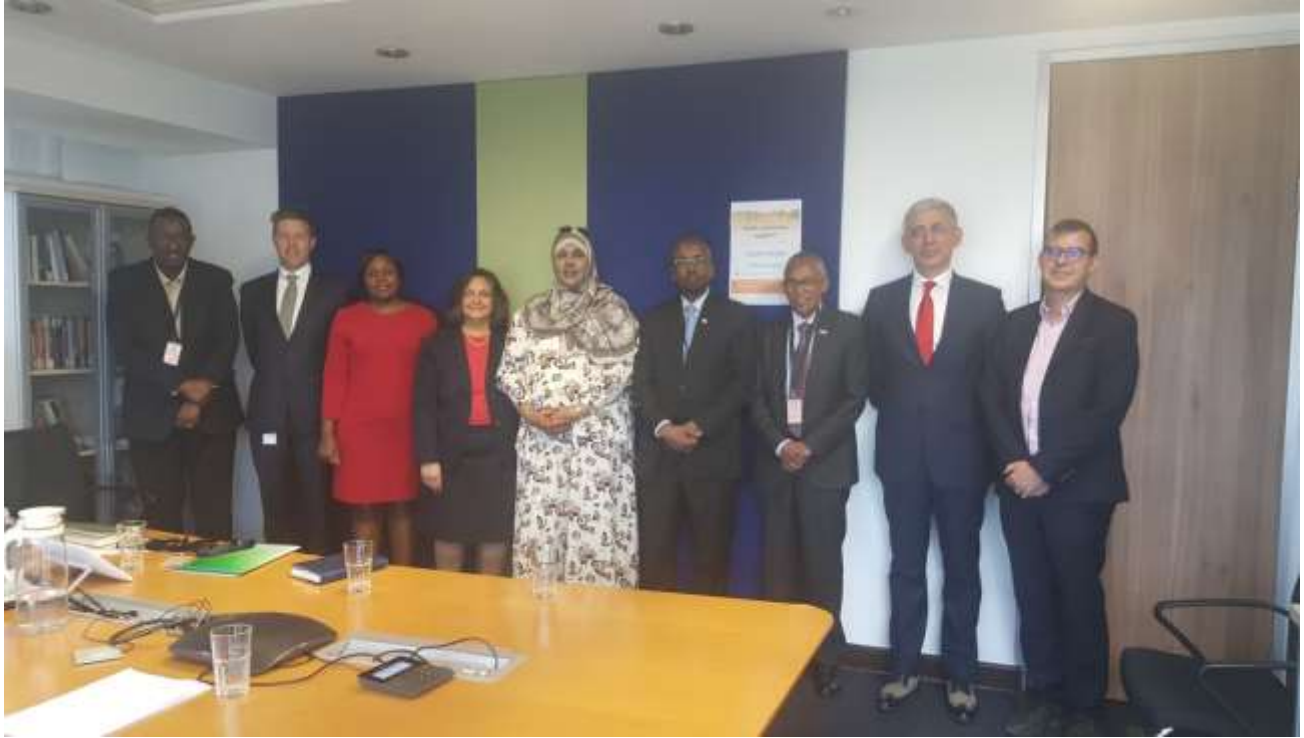
Xigasho: 2020, Guddoomiyaha Hay'adda Shaqaalaha Dawladda iyo wasiirrada maaliyadda iyo qoyska oo shir ku saabsan arrimaha hawl-gabka shaqaalaha Somaliland kaga qaybgalay Nairobi, Kenya

qabtay doodo iyo kulanno is daba joog aha oo lagu bixiyay wakhti badan si xal loogu helo siyaasad iyo xeer lagu maamulo shaqaalaha hawl-gaba ee qaranka uga baahan dheef ay xilligaa ku naalloodaan.