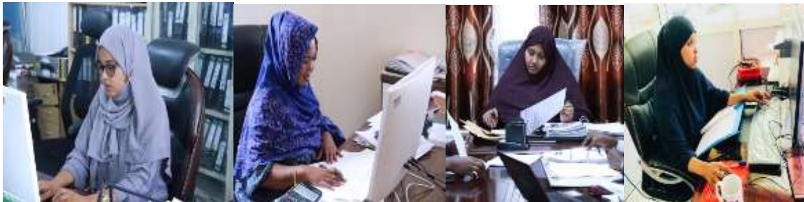
Agaasimayaasha Waaxda Tababarka Cudduda shaqaalaha, Agaasimaha Waaxda Maamulka iyo Maaliyadda, Agaasimaha Waaxda Shaqo Qorista Xulista iyo Dacalaacada Iyo Madaxa Xafiiska Kaydka Xogta Shaqaalaha

Sidoo kele waxa jira haween madax ka ah qaar ka mid ah xafiisyada muhiimka ah ee Hay'adda Shaqaalaha Dawladda oo aan ka xusi karno maamulaha xafiiska kaydka xogta shaqaalaha dawladda iyo Xafiisyo Kale.