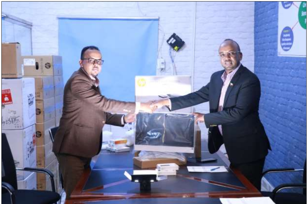
Xigasho: 2020, HSHD Guddoonsiintii qalabka ee wasaaradda Caddaaladda