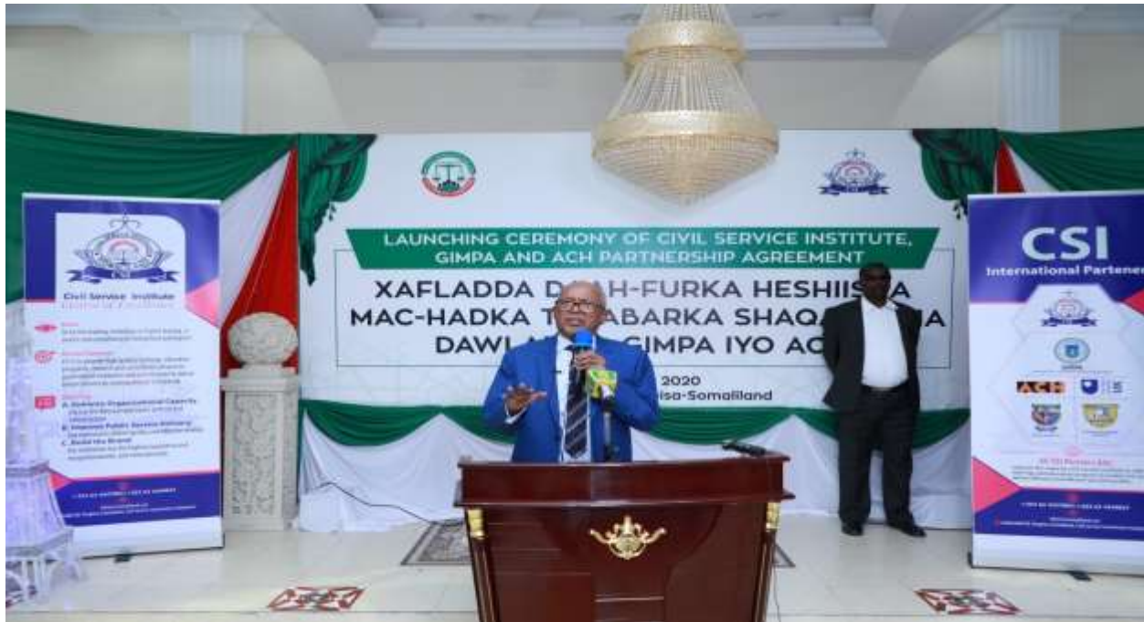
Xigasho; 2020 Madaxweyne ku xigeenka JSL oo ka qaybgalay xafladda daah-furka heshiiska mac-hadka shaqaalaha dawladda ee CSI iyo mac-hadka shaqaalaha ee dalka Gana ee GIMPA