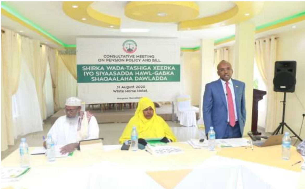
Xigasho: 2020, Shirkii Wada tashiga Xeerka iyo Siyaasadda Hawl-gabka qaranka

Sidoo kele waajibaadka shaqo ee xafiiskan hawl-gabka iyo xaqsiinta waxa ka mid ah in uu diyaariyo xuquuqda shaqaalaha geeriyooday ee dawladda u shaqaynayay, si eheladda dadkaasi ka geeriyooden loo siiyo wixii uu xuquuq ka helayo dawladda shaqaalahaas geeriyooday iyada oo la waafajinayo sharciga shaqaalaha dawladda ee xeer Lr.7/96 iyo siyaasadda qaran ee hawl-gabka iyo xaqsiinta shaqaalaha qaranka.