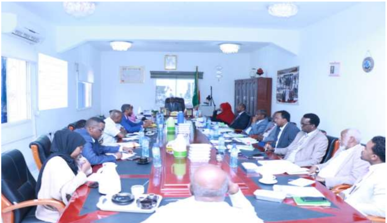
Xigasho; 2020, hshd kulanka sadex-biloodlaha ahaa ee xubnaha gudiga mashruuca (streering committee)