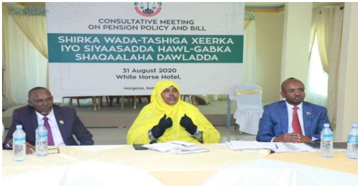
Xigasho: 2020, Shirkii Wada tashiga Xeerka iyo Siyaasadda Hawl-gabka qaranka