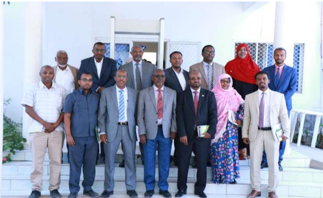
Xigasho; 2020, hshd kulanka sadex-biloodlaha ahaa ee xubnaha gudiga mashruuca (steering committee)

Sidoo kele intii shirku socday waxa si faah faahsan loo lafo guray arimo badan oo ay ka mid yihiin heshiiska mac-hadka shaqaalaha dawladda ee CSI uu la galay Mac-hadka shaqaalaha dalka Ghana iyo kor u qaadista tababaradda macadku bixiyo ee uu siiyo shaqaalaha dawladda. Sidoo kele gudigu waxa ay ka doodeen hirgalint barnaamijka casriga ah ee habmaamulka shaqaalaha dawladda (Human Resource Information System) iyo arimo la xidhiidha horumarinta shaqaalaha dawladda.